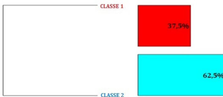
Figura 1 – Dendrograma referente ao significado ao termo “censo” em Estatística e para o que o censo é utilizado, segundo o grupo de alunos do ensino fundamental.

Utilizou-se a interpretação dos resultados realizada pela CHD, que se sustenta na hipótese de que o uso de formas lexicais similares se vincula a representações ou conceitos comuns. Assim, por meio dos resultados gerados pelo IRaMuTeQ, foi possível identificar que as partições realizadas no corpus do texto chegaram a duas classes finais, sendo que a Classe 1 representa 37,5% do corpus total e a Classe 2, 62,5%, identificadas pelo dendrograma da Figura 1.