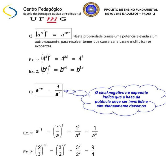
Figura 4 – Exemplos das Propriedades da Potenciação.