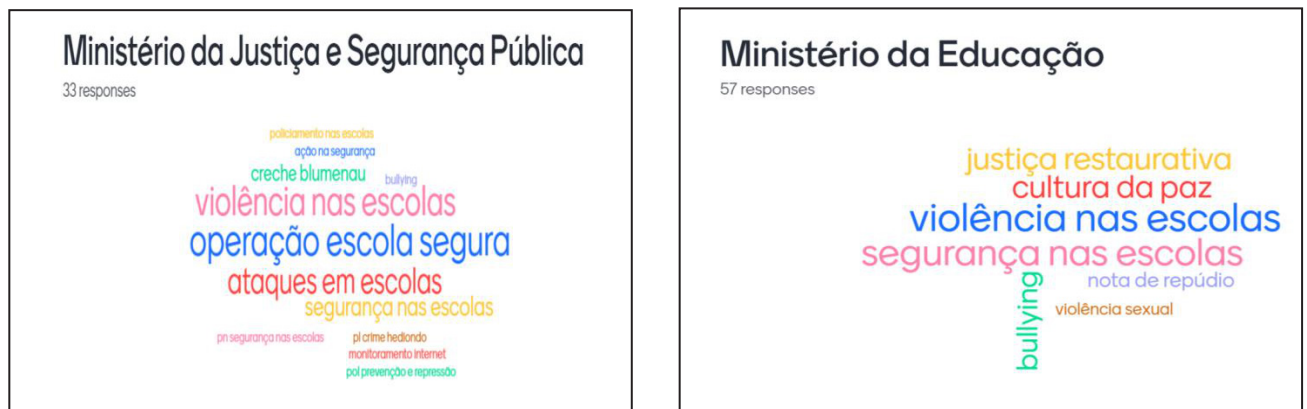
Figura 1 – Nuvem de palavras originadas da análise dos Portais do MJSP e MEC.

No terceiro ciclo de informações, identificamos 604 notícias considerando as palavras-chave “segurança na escola” e “violência na escola”. Destas, 181 no portal do MJSP e 423 do MEC. Nos portais, foram selecionadas notícias ou que tratavam do contexto nacional ou que versavam sobre a região Sul do Brasil. Foram, respectivamente, selecionadas 33 e 57, nos portais do MJSP e MEC. Quanto ao conteúdo a ser comunicado na notícia, que tinham como tema a violência nas escolas, a “Operação Escola Segura” 6 , seguida por “violência nas escolas” e “ataques em escolas” foram as mais recorrentes. Do conjunto dos conteúdos, observa-se, na Figura 1, a intencionalidade do setor em intervir sobre a violência nas escolas, especialmente por meio de leis e ações de repressão nas escolas.