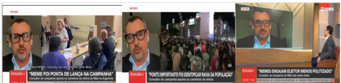
Figura 3 – Estratégia de campanha para os jovens “menos politizados”.