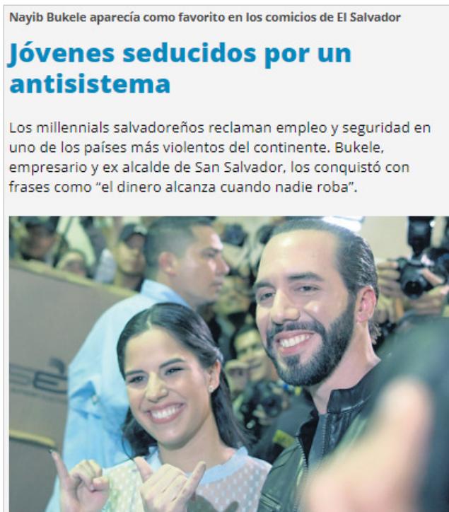
Figura 4 – Bukele seduz jovens por um antissistema.