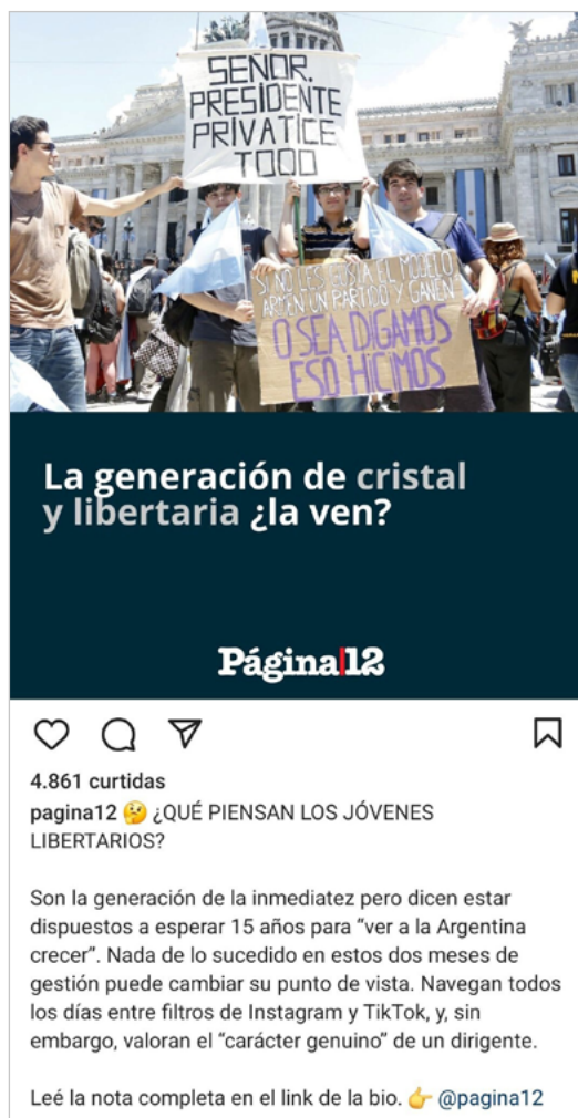
Figura 2 – Jovens “libertários”.

Há dados de que os jovens foram centrais na eleição de Milei (os eleitores com idades entre 18 e 29 anos representam quase 25% do eleitorado argentino, sendo que o voto de jovens, homens, sem educação superior e sem boas perspectivas no mercado de trabalho, do interior e com até 24 anos, está monopolizado pelo atual presidente) (Carmo, 2023). Um de seus principais apoiadores nas redes afirma que os mesmos são “soldados” que compõem as “forças celestes” do atual presidente. Segundo uma matéria do jornal BBC , “a maioria dos que votaram em Milei nas primárias e no primeiro turno das eleições é de homens entre os 16 e os 29 anos, embora quatro em cada dez eleitores fossem mulheres”, fartos dos “políticos de sempre”, a chamada “casta” por Milei. Assim, seu biógrafo resume o fenômeno: “ele deu esperança aos jovens que haviam perdido” (Smink, 2023, online ).