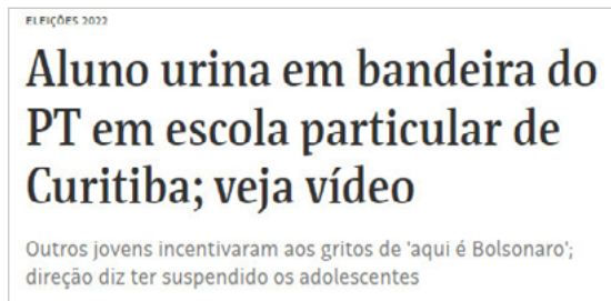
Figura 5 – Jovens estudantes gravam performance de ódio.