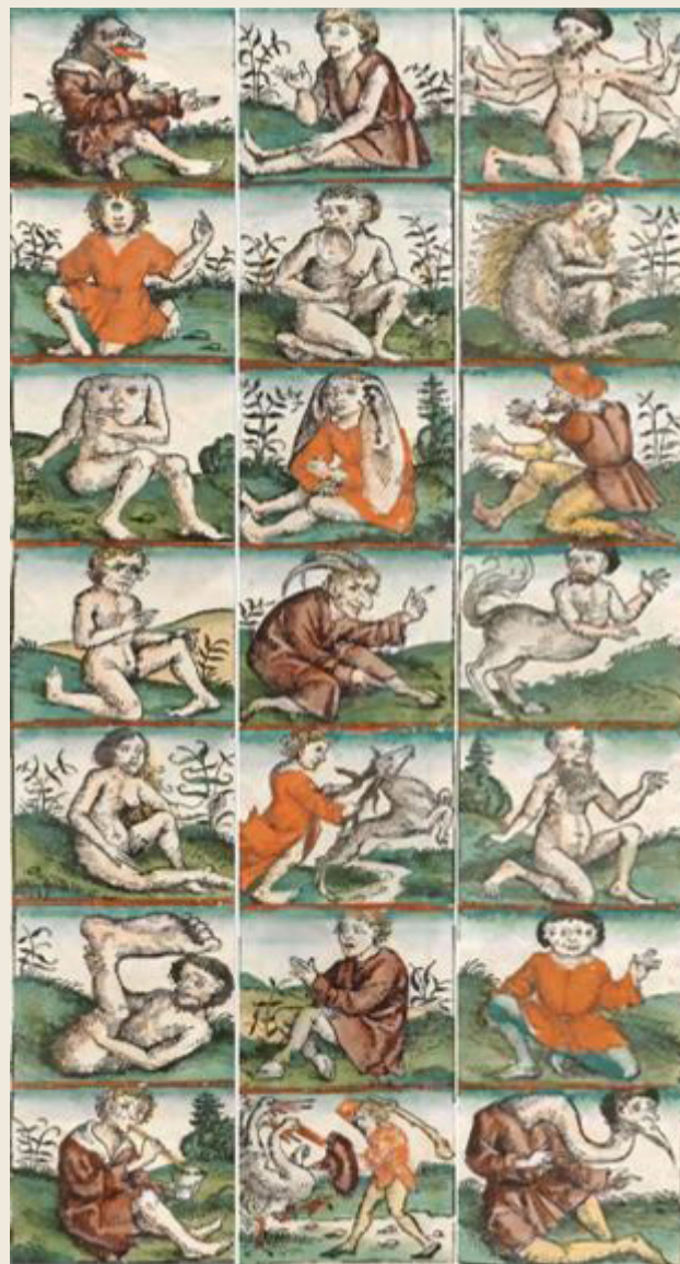
Figura 1 – Raças monstruosas.