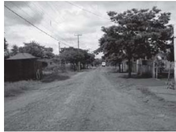
FIGURA 2 – Condomínio Residencial Ecogarden x Realidade de Sarandi – Loteamento Jardim das Torres. Fontes: Ecogarden Empreendimentos (2011, online ) e Mendes et al. (2008, p.11).

territoriais, transportando-se aos municípios vizinhos. A ideologia ou a estratégia de cidade-jardim pode-se manter, seja como elemento para induzir a atração/ocupação dos colonizadores do norte do Paraná, seja para promover a publicidade de empreendimentos imobiliários de alto padrão, como o Condomínio Residencial Ecogarden.