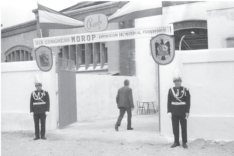
FIGURA 2 — Entrada al MOROP en Vilanova i la Geltru, 1972.