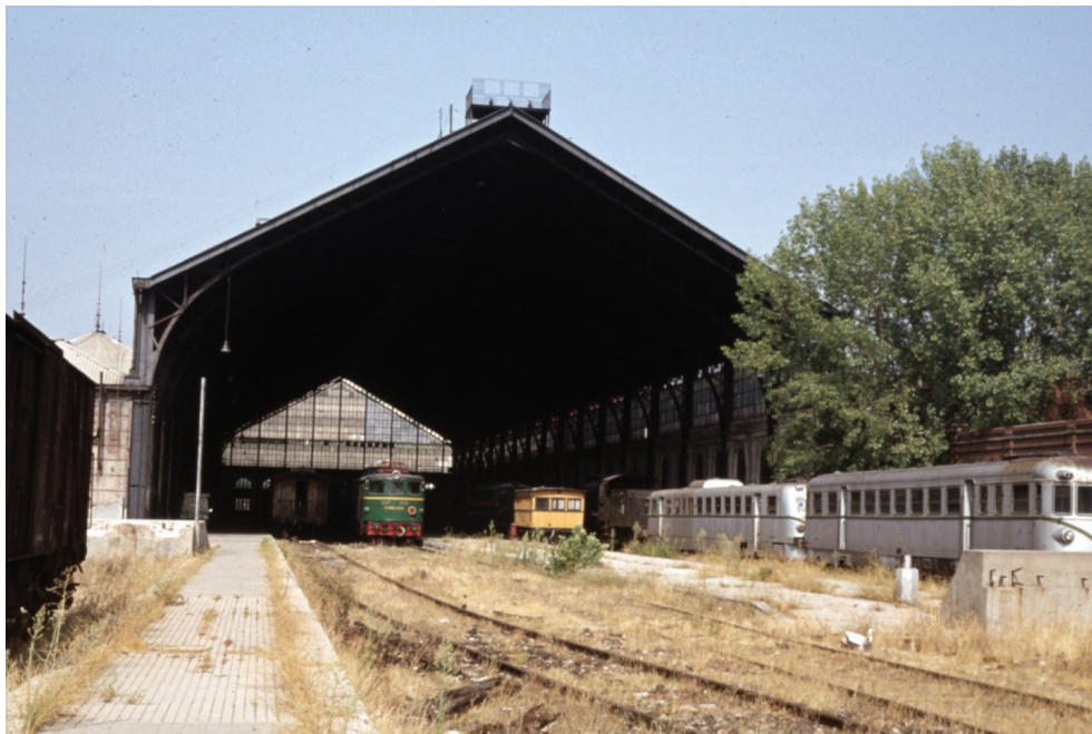
FIGURA 3 — Edificio de viajeros de Madrid-Delicias finales de los setenta. Fuente: Madrid-Delicias (1975-1980).