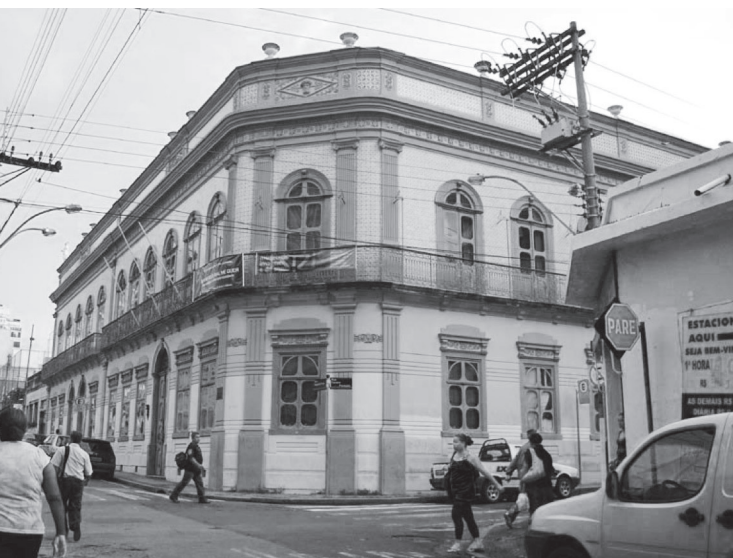
FIGURA 1 – Edifício do antigo Solar do Barão de Itatiba, construído em 1878, atual Palácio dos Azulejos, no centro de Campinas.

O conjunto das áreas envoltórias dos bens tombados no artigo 1º desta Resolução, previstas nos artigos 21, 22 e 23, da Lei Municipal nº 5885 de 17 de dezembro de 1987, constitui o Centro Histórico de Campinas, espaço de particular significação para o conhecimento da formação urbana desta cidade ( Diário Oficial do Município , Campinas, 1988).