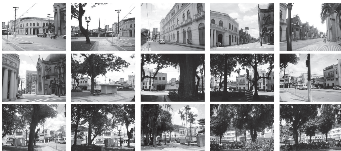
FIGURA 8 – Envoltória do edifício do Teatro Coliseu em Santos.