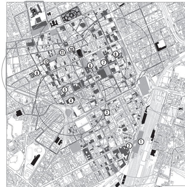
FIGURA 3 – Mapa com traçado dos 300 m de raio de preservação do entorno dos edifícios tombados no centro de Campinas. Fonte: Schicchi, 2008.

Em primeiro lugar, o conjunto dos traçados dos círculos de entorno de bens tombados, para ambas as cidades, comprova o que já se havia demonstrado há pelo menos vinte anos: quando somados, os contornos resultam na sobreposição das áreas de proteção e impõem uma proteção integral para os centros, porém não integrada, já que a característica multifacetada dos centros lhe impõe o convívio de diversidade de usos, significados e formas que se alteram às vezes com o simples atravessar da via. Essa condição faz que a análise de um contexto, mesmo contíguo, não possa servir de parâmetro para seu vizinho, sendo, portanto, inócuo estabelecer uma diretriz para o perímetro de sobreposição das áreas envoltórias, como se pensou como solução quando se propôs o tombamento conjunto dos edifícios de Campinas (Resolução nº. 001 de 1988).