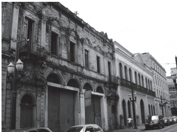
FIGURA 2 – Casario de Santos. Ao centro, a Casa de Frontraria Azulejada construída em 1865 que sofreu um incêndio na década de 1950 e foi finalmente restaurada em 2008.

É necessário destacar ainda que os planos diretores só vão constituir metodologias capazes de incorporar o desenho na escala local e operar por setores (a rua, a quadra, os dimensionamentos, qualidades estéticas e volumetrias, acessibilidade e conforto urbano) com projetos e programas urbanos específicos, a partir da década de 1990, ou seja, esse processo de constituição de organismos de preservação operando bem próximo da escala de problemas cotidianos, identificados pelo cidadão, usuário ou habitante, é coincidente com alguns instrumentos urbanísticos aprovados mais recentemente e com a mudança de visão do planejamento urbano 6 .