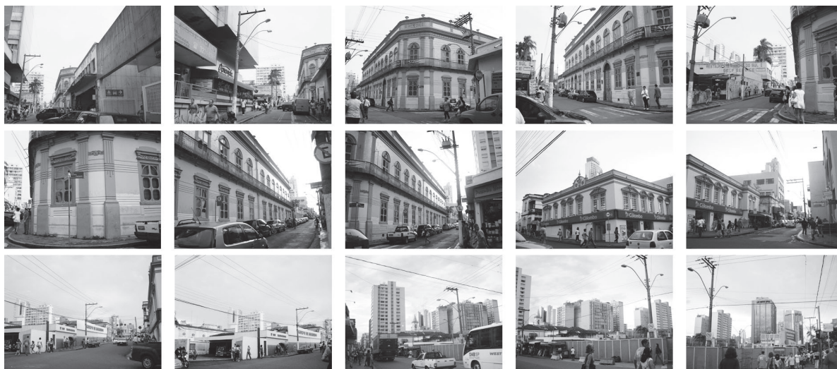
FIGURA 7 – Envoltória do edifício Palácio dos Azulejos em Campinas.