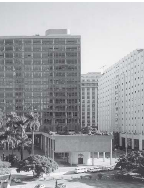
FIGURA 3 – Ministério da Saúde e Educação Pública, Rio de Janeiro (1936).

Nas edificações do século XX, período no qual o modernismo começara a se instalar definitivamente nas cidades brasileiras, foram realizadas análises de três edificações: a do Ministério da Educação e Saúde Pública, de 1936 (Figura 3), localizada no Rio de Janeiro; a do edifício Itatiaia, de 1952 (Figura 4), edifício residencial, localizado em Campinas; e a torre Faria Lima de 2004 (Figura 5), parte do complexo Ohtake Cultural, edifício de serviços, localizado em São Paulo. Também as edificações foram escolhidas com o objetivo de representar o final e o início do século. Para buscar uma representatividade das edificações em diferentes regiões metropolitanas, foram escolhidas as edificações na cidade de Campinas, São Paulo e Rio de Janeiro. Para as