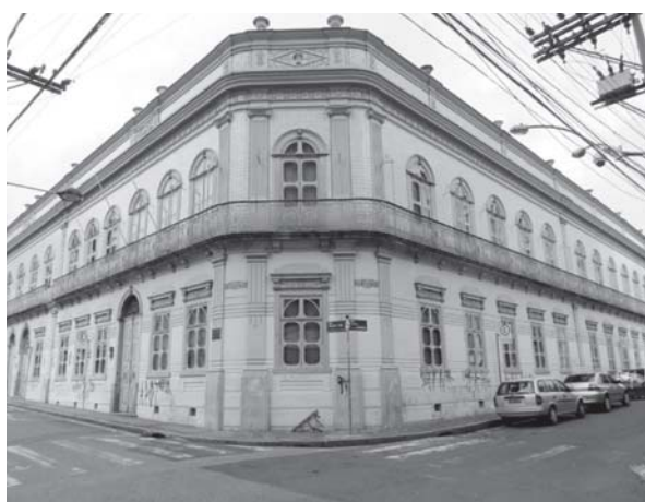
FIGURA 1 – Sede da Fazenda Mato Dentro, Campinas/1806. Foto: Verônica Stefanichen Monteiro (Julho de 2011).