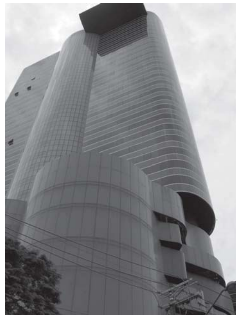
FIGURA 5 – Complexo Ohtake Cultural, Torre Faria Lima, São Paulo (2004).