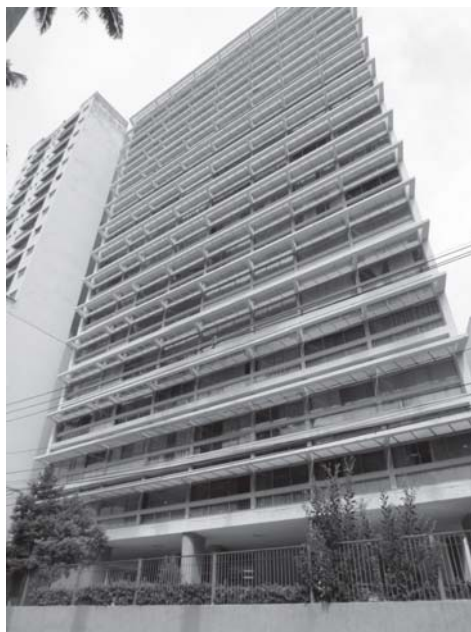
FIGURA 4 – Edifício Itatiaia, Campinas (1952). Foto: Verônica Stefanichen Monteiro (Agosto de 2011).