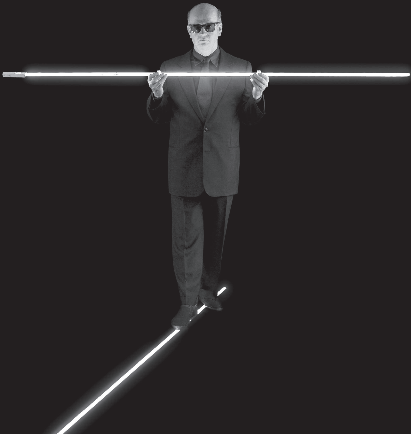
Artes Plásticas – Performance: Eletroperformance.