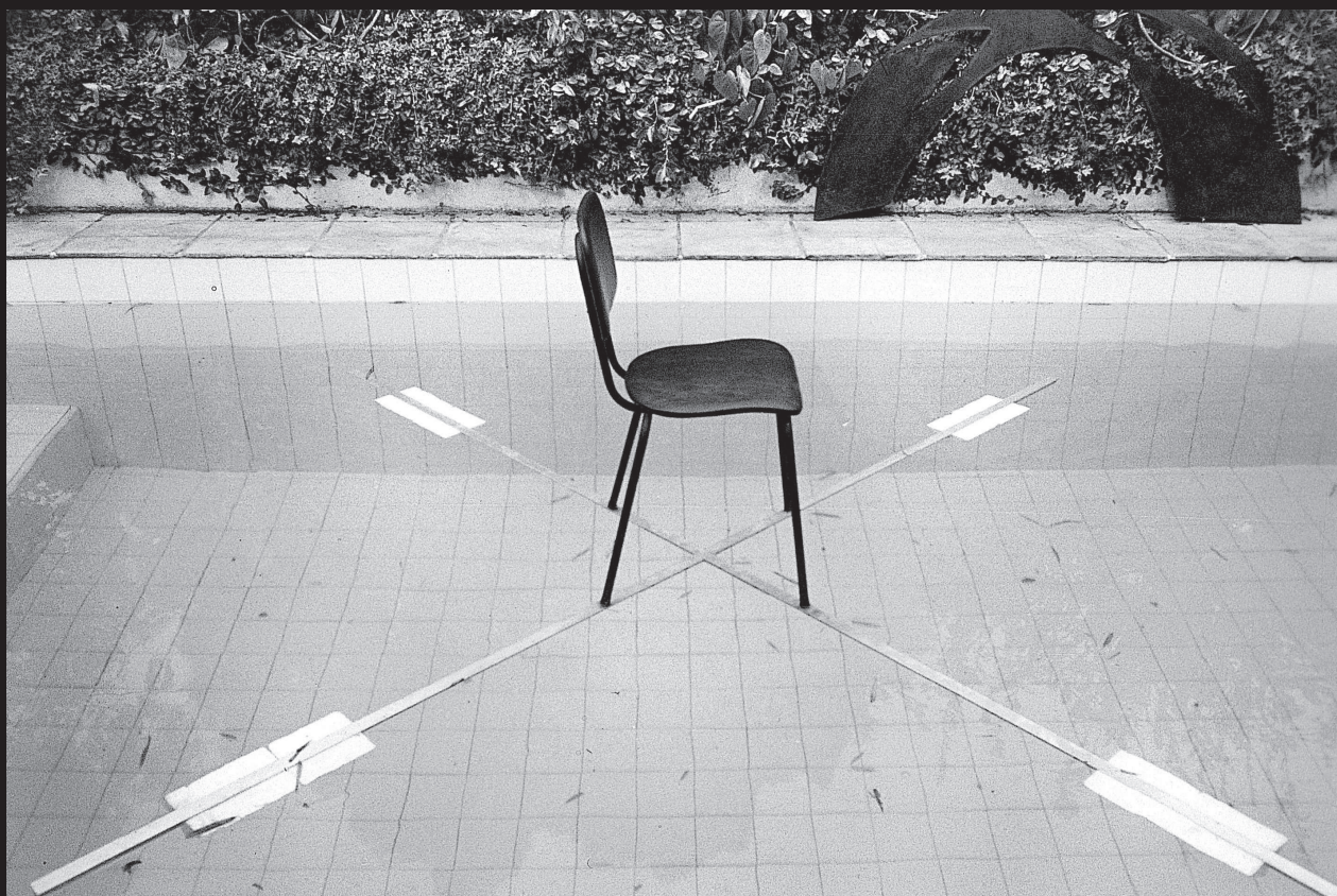
Artes Plásticas – Mix: Auditório para questões delicadas: modelo.