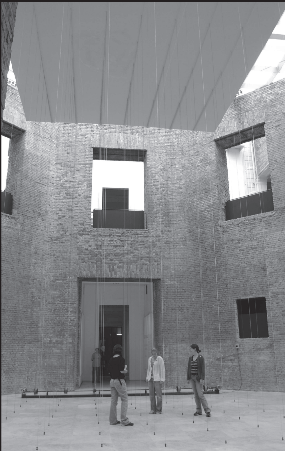
Artes Plásticas – Mix: garoa modernista.