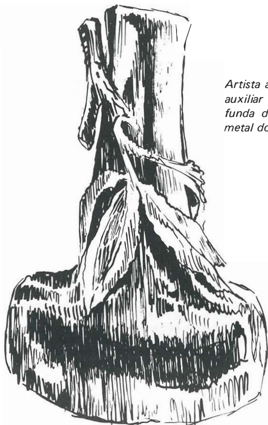
Artista anônimo, austríaco. Para auxiliar a cor sombreada e profunda da terra, foi colocado o metal dourado (Col. M. Thomas).

que a preocupação dos autores era muito grande em relação à fiel imitação de obras antigas, ocorrendo o mesmo no que tange à observação do academismo.