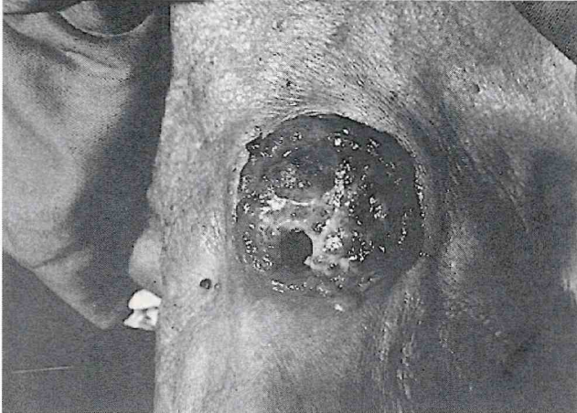
FIGURA 1. Tumor ulcerado ocupando 3/4 da circunferência do orifício do traqueostoma.